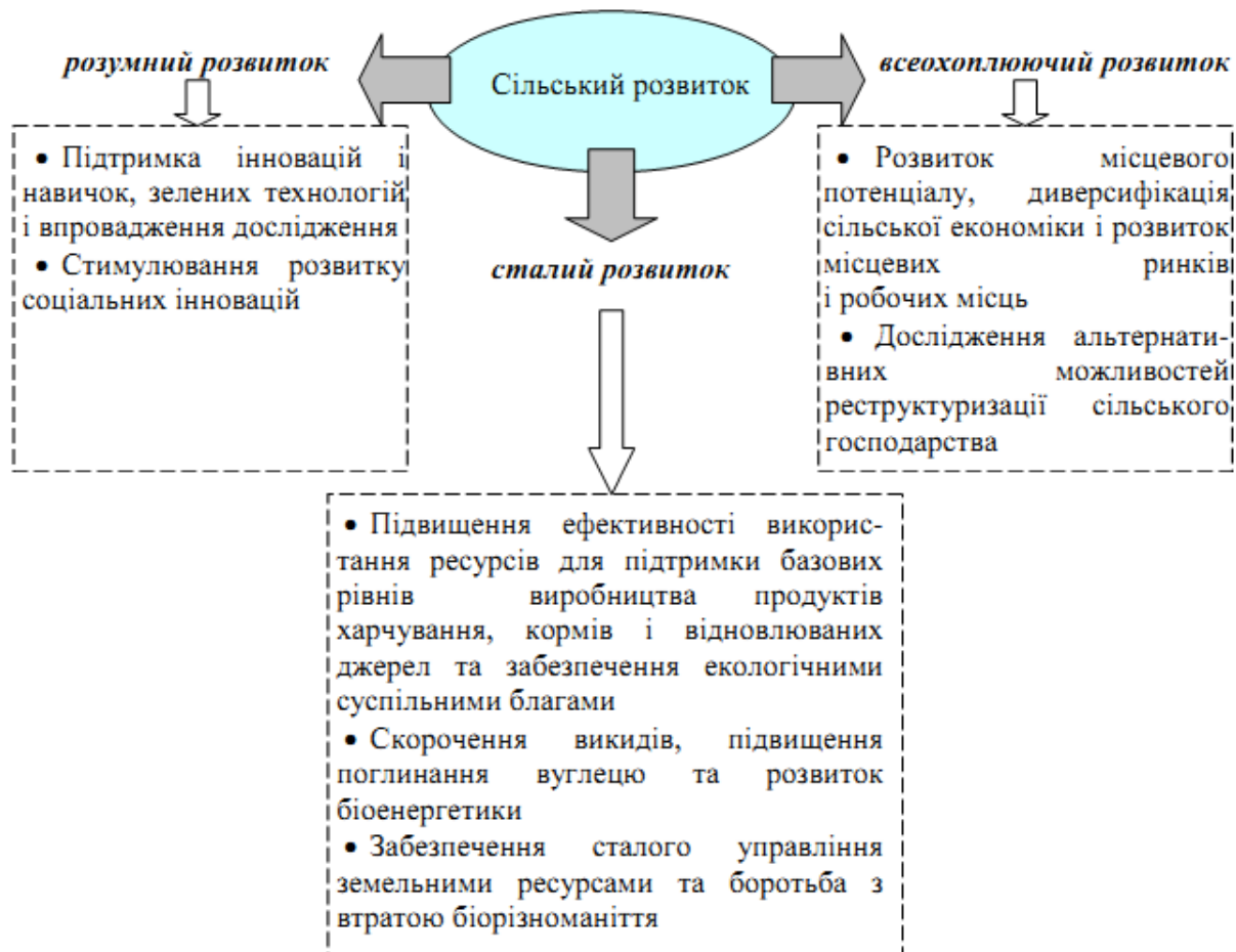
Рис. 2. Сільський розвиток в контексті Стратегії «Європа 2020» [8]

рядування достатній рівень мотивації для заохочення інвесторів вкладати кошти в економіку відповідних сільських територій, а з іншого, дає змогу найбільш раціонально розпоряджатися бюджетними коштами, спрямовуючи їх у ті сфери господарської діяльності, які є пріоритетними для кожної сільської території [9].