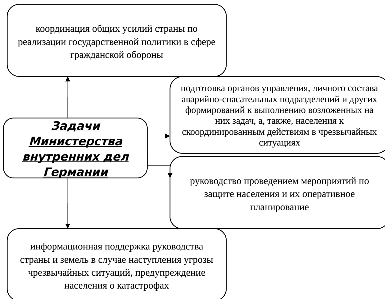
Рис. 2. Основные задачи Министерства внутренних дел Германии

В Германии Министерство внутренних дел отвечает за все вопросы, связанные с организацией защиты населения и территорий от чрезвычайных ситуаций, стихийных бедствий техногенного и природного характеров. Основные задачи Министерства внутренних дел Германии представлены на Рис.2.