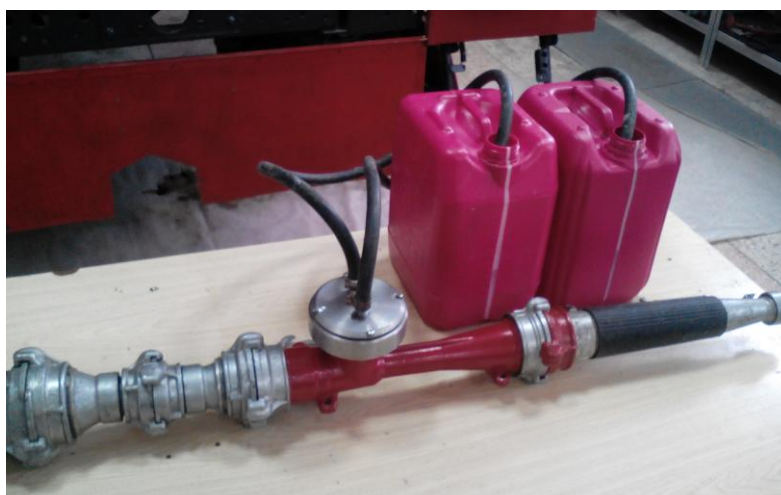
Рис. 2. Внешний вид портативного устройства эжекционного типа для получения огнетушащего геля

Целью этой публикации является теоретическое обоснование эффективности эжекционного способа подачи гелеобразующих систем при