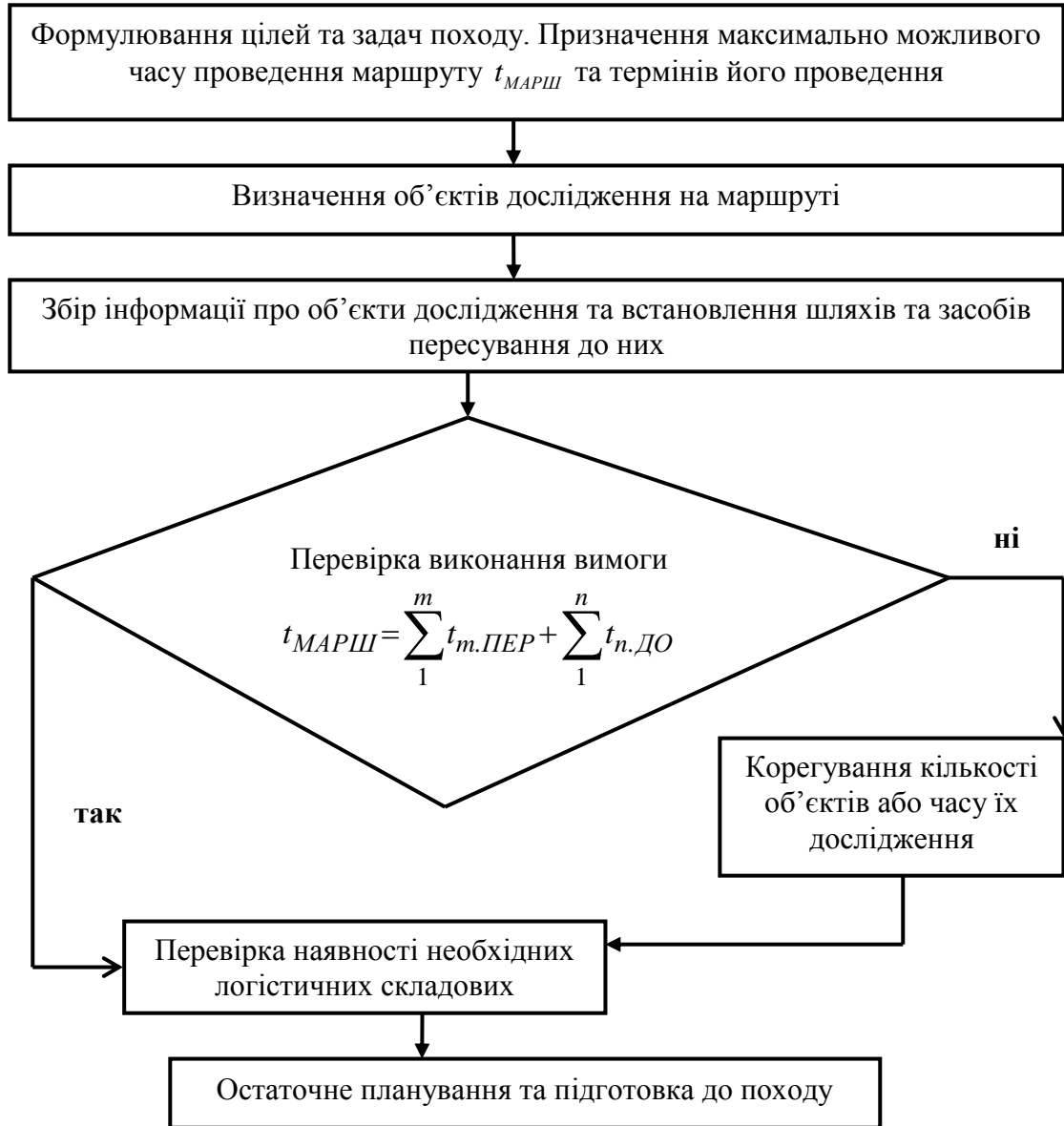
Рисунок 3 – Схема алгоритму планування походу

де: t_{МАРШ} – час проходження маршруту; t_{m.ПЕР} – час кількості m переміщень групи на маршруті; t_{n.ДО} – час на дослідження n об'єктів, які заплановані.