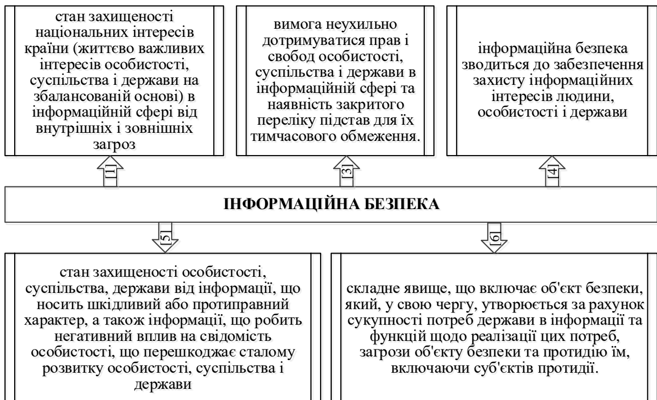
Рис. 1. Основні визначення поняття «інформаційна безпека»

Тому є доцільним дослідити дефініцію ключового поняття даної статті – «інформаційна безпека» шляхом опрацювання наукових трудів з цієї проблематики та надати власне авторське визначення цієї категорії, виходячи із сучасного стану справ у цієї галузі в Україні. Для цього на рис. 1 покажемо основні визначення поняття «інформаційна безпека», які наведені у відповідних наукових працях [1, 3-6].