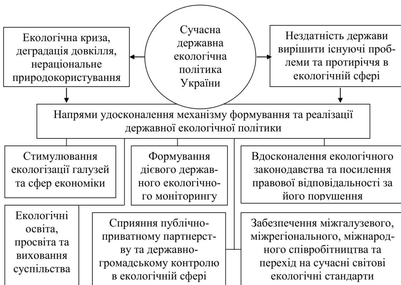
Рис. 2. Напрями удосконалення механізму формування та реалізації державної екологічної політики України

Удосконалення механізму формування та реалізації державної екологічної політики в Україні в сучасних умовах доцільно здійснювати за напрямками, наведеними на рис. 2.