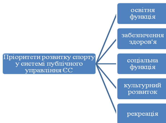
Рис. 4. Пріоритети нормативного забезпечення процесів публічного управління фізичної культури та спорту ЄС [1]

Розглядаючи нормативне забезпечення процесів розвитку спорту у країнах ЄС можна визначити наступні пріоритети – рис. 4.