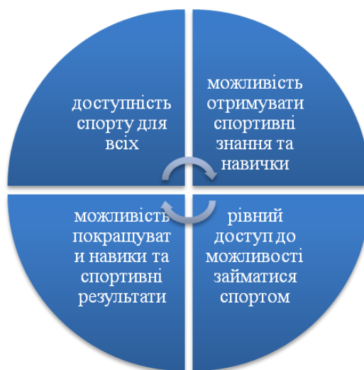
Рис. 3. Пріоритети Кодексу спортивної етики [8]

Аналізуючи міжнародне та європейське законодавство у сфері фізичної культури та спорту доцільно визначити, що провідні країни світу розглядають систему публічного управління галуззю через призму надання адміністративних послуг із фізичної культури та доступу до спорту. Відповідно базові пріоритет сформовані навколо цінностей людини, її вимог та запитів. Система пріоритетів з орієнтацією на людину сформувалася лише після Другої світової війни, тоді ж спорт почав розглядатися як форма бізнесу, що визначило комерційну складову його розвитку та необхідність розробки нормативних документів у сфері регулювання бізнес-процесів у спорті для їх прозорості, чесності та неупередженості.