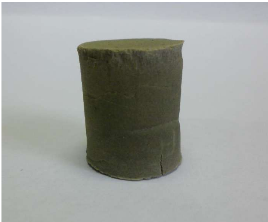
Рис. 1. Зовнішній вигляд зразка Ba_3CaAl_2O_7 ( t_{\text{вип}}=1380\text{--}1400\text{ }^\circ\text{C} , \tau=3 год).

Так, виявлено, що сполука Ba_3CaAl_2O_7 бурхливо реагує при замішуванні водою, причому реакція взаємодії супроводжується підвищенням температури до 55\text{ }^\circ\text{C} і збільшенням об'єму суміші. Окрім того, підвищення температури спричиняє інтенсивне випаровування води, і, як наслідок, різко збільшується водопотреба ( B/C=1,64 ). Зразки характеризуються високою пористістю та низькою міцністю при стисканні (2 МПа після 28 діб тверднення).