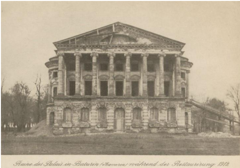
Руїни палацу в Батурині («Батурин») під час реставрації 1912

було п'ятитомне видання Олександра Васильчикова «Сімейство Розумовських» [7, с. 7]. Варто відзначити, що Каміл надавав інформацію та матеріали автору під час написання цієї праці. «Дорогий кузене, як я можу віддячити тобі за твою доброту та довіру, яку ти виявив до мене? ... Я прочитав ваші папери і зробив з них необхідні нотатки. Тож я не хочу їх тримати ні на мить довше... Дозвольте мені тримати портрети ще деякий час...»