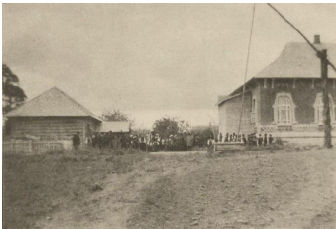
Lemeschi. Die auf dem Platze der Rasumowitscha (Geburtsstätte Maxym. Krawtschyns) 1910. erbaute Volksschule an der die Gedenksteine in der beiden Brüder angebracht sind

У 1913 р. побачила світ праця присвячена гетьману Кирилу Розумовському «Graf Kirill Grigoriewitsch Rasumovsky. 1728–1803». До її написання спонукало те, що у бібліотеці Каміла Розумовського було чимало матеріалів про життя і діяльність гетьмана, про місця де він працював та жив, і які він особисто відвідав. Ще однією з причин було бажання ознайомити своїх дітей із життя їхніх прабатьків. «Якщо мої діти виявлять інтерес до насиченого подіями життя своїх предків, та якщо вони знайдуть інтерес до їх благородного духу та їхньої людяності, і якщо вони намагатимуться вшанувати їхню пам'ять у своєму власному способі життя, тоді мої зусилля будуть