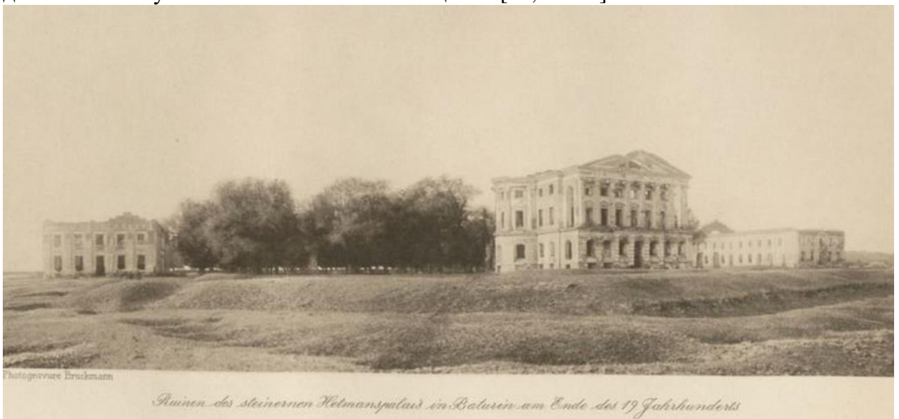
Палацово-парковий ансамбль Кирила Розумовського. Кінець XIX ст.

Будучи австрійським підданим він не забував своє українське коріння і став одним із перших, хто виявив зацікавленість до минулого своїх славних пращурів, вивчав та збирав матеріали про історію свого роду [8, с. 7]. Аналізуючи його листування з Олександром Васильчиковим, правнуком Кирила Розумовського по лінії доньки Ганни, істориком, директором імператорського ермітажу, можемо припустити, що активно досліджувати свою родину Каміл Розумовський почав на початку 80-х років XIX ст. Зокрема на це вказує лист від 24 вересня 1880 р. Олександра Васильчикова до Каміла: «Я щойно отримав Вашого люб'язного листа з цікавими повідомленнями, які ви до нього додали. Я дуже вдячний за те, що ви дали мені можливість познайомитися з двоюрідним братом. ... Я вражений, що ви так добре знаєте, хто ваші родичі в росії. Я надішлю вам докладний список родини, виправивши деякі помилки у вашій генеалогічній таблиці ...» [16, с. 225].