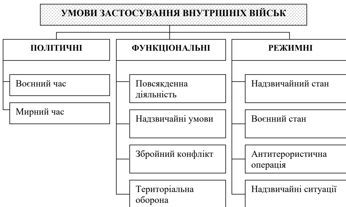
Рис. 1. Класифікація умов застосування внутрішніх військ

Класифікація умов застосування внутрішніх військ з урахуванням норм МГП може здійснюватися з різних підстав. Проведені дослідження дали змогу запропонувати варіант класифікації таких умов, що представлений на рис. 1.