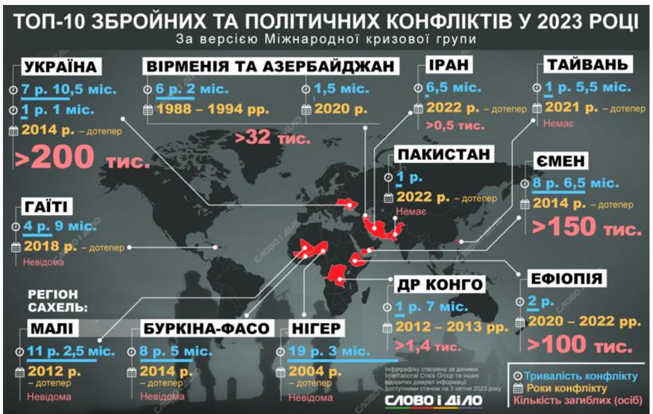
Рис. 3. Найбільша кількість збройних і політичних конфліктів у світі у 2023 році

Дослідницька організація International Crisis Group (далі – ICG) поставила повномасштабну війну в Україні на перше місце серед десяти збройних конфліктів у 2023 році, за якими варто стежити (рис. 3).