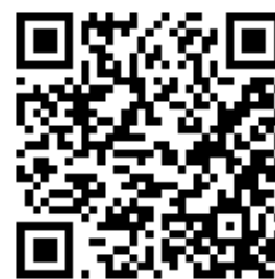
QR-код посилання на відео-інструкції

Спираючись на ці пункти, дослідження та власний досвід, нами був розроблений проєкт “Презентація власної ідеї з використанням інформаційно-комунікаційних технологій” для студентів різних спеціальностей, який викладається на основі системи flip learning. Проєкт складається з 10 етапів, що охоплюють всі заплановані теми робочої програми курсу та має на меті дослідити цікаву студенту тему за спеціальністю навчання та створити документацію для цього дослідження: від опитування до промо-ролика. До кожного етапу проєкту надається опис виду діяльності, вимоги до виконаної роботи та посиланнями на відео-інструкції з користування додатків, сервісів що були необхідні під час виконання етапу. Всі відео містяться у окремому списку відтворення YouTube і завжди доступні для перегляду. Основна увага приділяється саме на реалізації власної ідеї здобувача, на основі доступності та гнучкості викладання, при використанні доступної цифрової техніки: комп'ютера, смартфона.