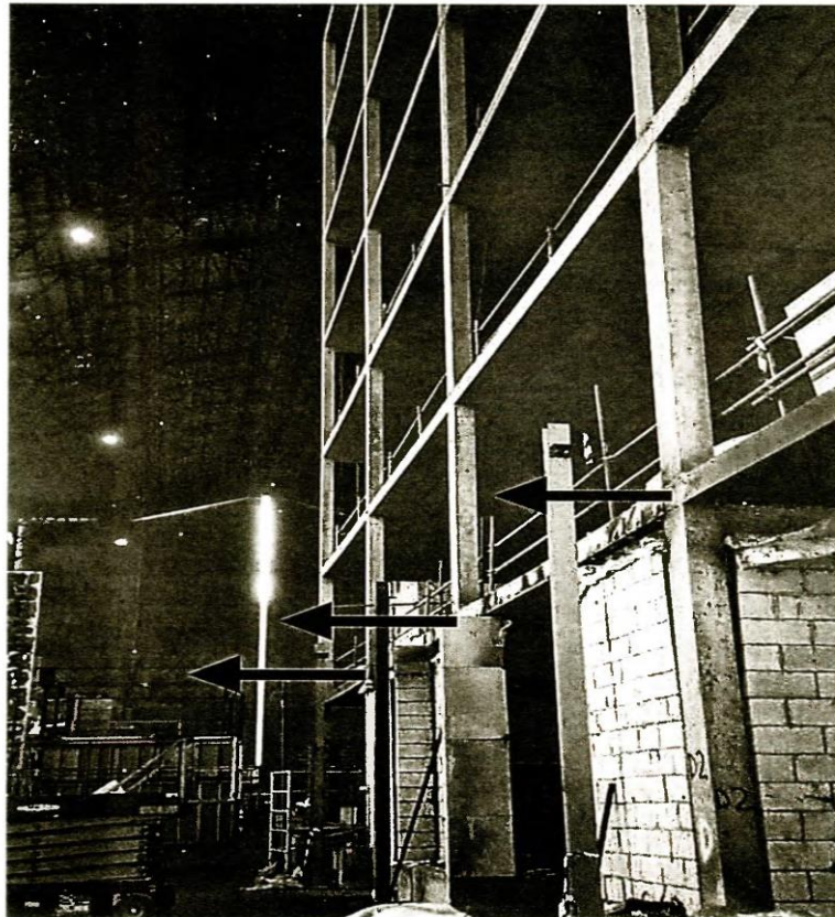
Рис. 3. Випробування на вогнестійкість у Кардінгтоні (Великобританія): поперечне переміщення крайніх колон внаслідок стисненого теплового розширення.

Стосовно вимог, щодо ізоляції стику, для забезпечення його вогнестійкості, то зазори у стиках між елементами мають бути не меншими за 20мм і не глибше за половину мінімальної товщини з'єднувальних елементів [14].