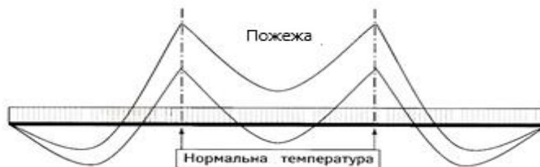
Рис. 1. Епюра моментів у нерозрізній конструкції.

Під час пожежі, внаслідок теплового розширення поверхні балки або плити перекриття, з'являється вигин, який спричиняє збільшення опорних моментів [14]. Це може сприяти текучості арматури стиснутої зони, якщо не вжити заходів ще на стадії проектування. Щоб запобігти цьому потрібно передбачити напусток арматури у опорних зонах залізобетонних конструкцій перекриття. Збірні конструктивні елементи заводського виготовлення, як правило, являються вільно спертими і мають достатню несучу здатність на вигин, що запобігає збільшенню опорних моментів.