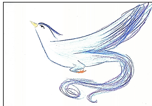
Рис. 2. Власне тату

М.: 90 Я підбрала репродукції до малюнку «Власне тату» (рис. 2). Цей малюнок (рис. 4) для мене означає прощання з тим образом хлопчика, якого чекали замість мене. Мама дуже сильно хотіла, щоб народився хлопчик, і назвати його в честь батька, а народилася я.