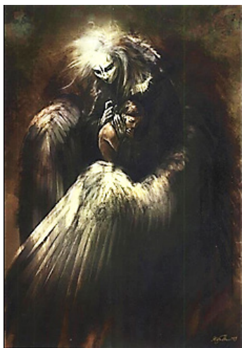
Рис. 5. В. К. Салонен. Хороша мрія

М.: 92 У комплексі моїх психомалюнків хлопчики з дівчатками не відрізняються один від одного, хіба що прикріпленим бантиком і сукнею. Це як бажання відліпитися від цього образу хлопчика (рис. 3), я залишаю йому квіточку, виходжу з води і йду кудись.