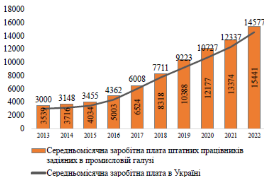
Рисунок 1 – Динаміка розмірів величини середньомісячної заробітної плати штатних працівників, задіяних в промисловій галузі та середньомісячної заробітної плати в Україні за період 2013 – 2022 рр.