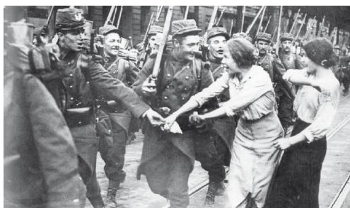
Мал. 3. Мобілізація в Німеччині [4, с. 22]

... Така армія, в головній своїй масі, ненавиділа державу, якій служила, а народ ненавидів військову службу, й через те і свою, ніби-то, армію. Військо рефлексивно віддячувало ненавистю народів, помагаючи пануванню небагатых» [13, с. 16]