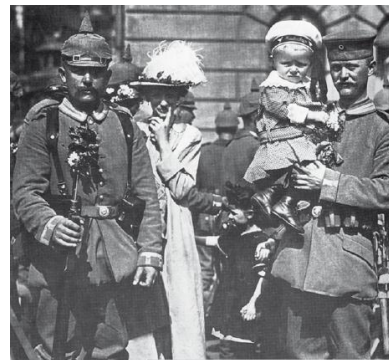
Мал. 4. Мобілізація у Франції [4, с.22]

І, звичайно, у воєнній пропаганді, коли держава бажає дешево воювати, а не заохочувати добровольчий рух, головним ворогом стає він – «ухилянт». Пропаганда мобілізації на прикладі, як робити не треба, буває досить ефективною. Головним завданням такої пропаганди є перш за все ізолювати будь-яку альтернативну думку. Дуже подібною є методика ведення пропаганди під час війни на окупованих територіях, що підтверджують дослідження, проведені Б. Вілкіном [9, 10], а також серія досліджень Джеремі Блека [1, 2], де окрім детального висвітлення озброєнь та тактики сторін, велику увагу автор приділяє і вивченню пропаганди та контрпропаганди. Та одним із найсерйозніших досліджень у цій галузі є праця Елізабет Фондрен та Джона Максвелла Гамільтона «Універсальні закони пропаганди: Перша світова війна та походження формування наративів державою» [5]. Але попри кількість розробок із опису та вивчення пропаганди, як явища, та конкретно пропаганди війни, в кін. ХХ – поч. ХХІ ст. не було великих воєнних конфліктів, куди були б задіяні таким чи іншим чином більшість великих світових держав чи таких, що радикально би вплинули на зміну світового порядку, встановленого після Другої світової війни, тому було важко апробувати на практиці глобальні