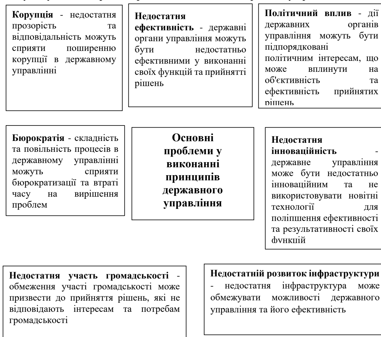
Рисунок 1 - Основні проблеми у виконанні принципів державного управління [2]

Існує низка проблем у виконанні принципів державного управління, які можуть суттєво підірвати ефективність та сталість розвитку країни: