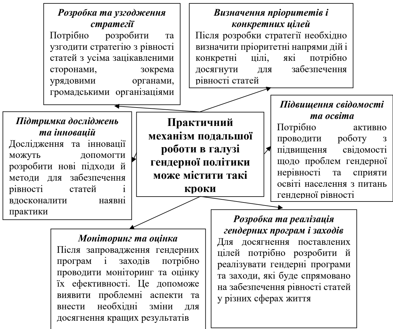
Рисунок 1. Етапи практичного механізму подальшої роботи в галузі гендерної політики [1]

На рисунку 1 зазначено етапи практичного механізму подальшої роботи в галузі гендерної політики.