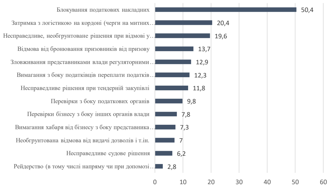
Рис.1. Проблеми бізнесу у взаємовідносинах з органами влади, %

Виявлено найбільшу проблему бізнесу у тому, що податкова служба блокує податкові накладні, а саме із 504 опитаних, так вважає половина респондентів (50,4%). Це призводить до неможливості здійснювати нормально діяльність малого бізнесу. Податківці не обґрунтовують свої рішення, «Чинний порядок блокування ПН/РК значно сповільнює бізнес, а недотримання регіональними податківцями їхніх обов'язків щодо обґрунтування причин блокування ПН/РК та неврахування Таблиці даних призводить до втрат бізнесом часу, грошей та репутації» [1].