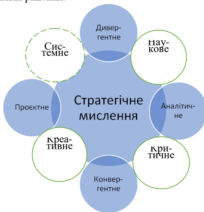
Рис. 1 Графічна інтерпретація рекомендованої моделі стратегічного (множинного) мислення особи

Тільки в цьому разі мислення працівника можна вважати насправді стратегічним, оскільки саме поєднання різних видів інтелектуальної активності дозволить усебічно аналізувати, обґрунтовувати, генерувати й ухвалювати правильні рішення.