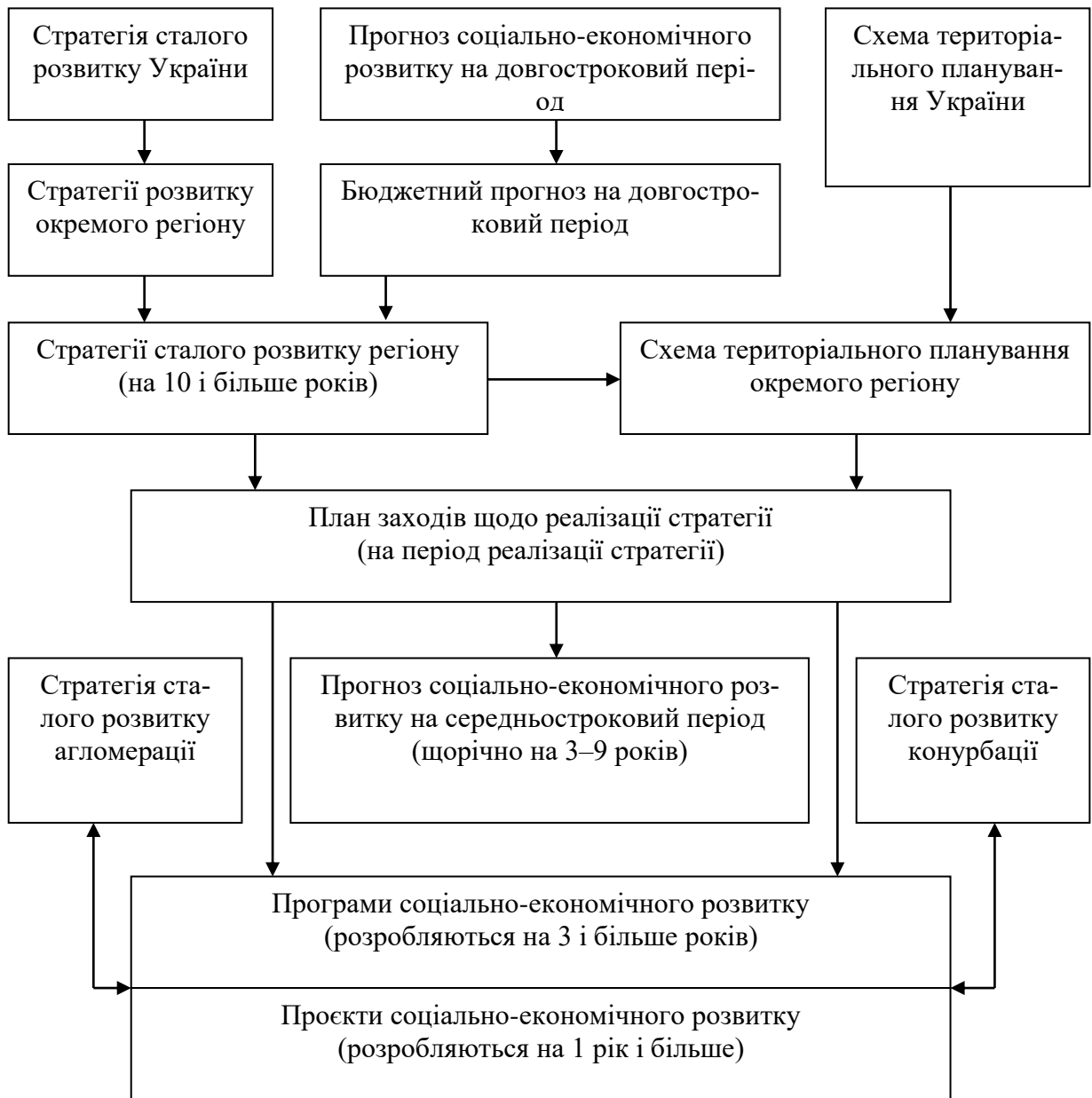
Рис. 2. Система стратегічного та оперативного планування міських агломерацій зокрема та в Україні загалом

ключну роль. Хоча на практиці може бути все навпаки: потужні об'єднані громади стають ще більш конкурентними акторами, а великі міста – не зацікавленими в агломераційних процесах. Дана проблема є актуальною для України, свідченням чого є диспропорції у розвитку її громад і територій. Крім того, складності додає правова норма аналізованої стратегії щодо «територій сталого розвитку», зокрема, не зрозуміло, чому ці території не розглядаються нормо твоями в межах міських агломерацій, а якось відірвано від загального контексту.