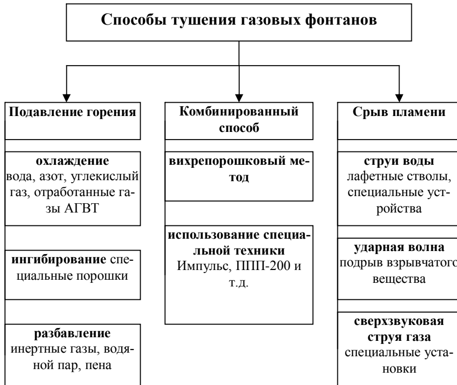
Рис. 1. Способы тушения газовых фонтанов

Следует сказать, что главной проблемой, с которой сталкиваются подразделения МЧС при тушении газовых фонтанов перечисленными способами является малое расстояние подачи огнетушащих средств к фонтану. Так, нормативными документами для тушения лафетными стволами и автомобилями ГВТ, установлена оптимальная дальность подачи – 15 м [1, 2, 4]. Однако расчет безопасного расстояния отдаления личного состава от скважины показывает, что уже при дебите фонтана 0,5 млн м 3 /сутки, оно составляет примерно 50 м. При увеличении дебита этот показатель возрастает и для скважины с дебитом 3 млн куб м/сутки составляет 120 м. Безопасное расстояние определяется как [5]