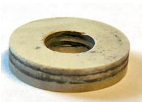
Рис. 2 – Фотография образца слоистого сегнетомагнитного композита

Исследования проводились на экспериментальных стендах и в соответствии с методиками, идентичными с описанными для образцов сегнетокерамики, синтезированных по технологии высокотемпературного спекания.