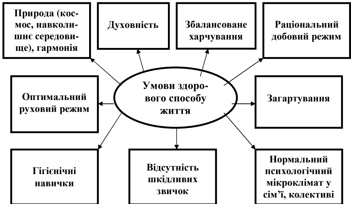
Рис. 4 – Умови здорового способу життя

Знання, володіння і застосування здоров'язберігаючих технологій є важливою складовою професійної компетентності сучасного педагога. Застосування здоров'язберігаючих технологій є важливою складовою навчально-виховного процесу. Вважаю, що уроки мають бути здоров'язберігаючими, здоров'яформуючими, здоров'язміцнювальними, спрямованими на формування позитивної мотивації на здоровий спосіб життя, учити культурі здоров'я.