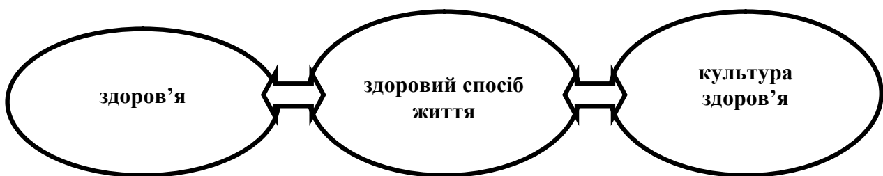
Рис. 3 – Тріада здоров'я життя

Збереження і відновлення здоров'я залежить від рівня культури і становить культуру здоров'я людини. Тому поняття «здоровий спосіб життя» розглядається у співвідношеннях тріади (рис. 3).