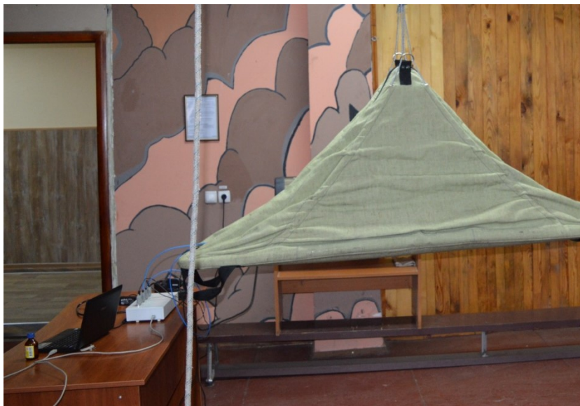
Рис. 1. Зовнішній вигляд випробувальної установки

Було проведено експеримент на установці "Ноші захисні рятувальні" [8-10], що обладнано термопарами та аналогово-цифровим приладом підключеним до комп'ютера зі спеціальним програмним забезпеченням, що дозволяє формувати масив даних в заданому інтервалі часу з заданим інтервалом вимірювань (рис. 1).