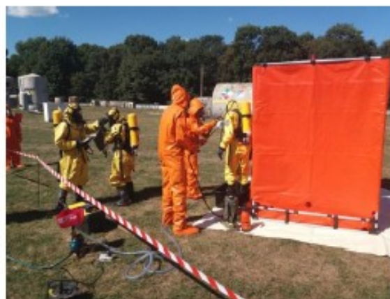
Рис. 7 – Проведення деконтемінаційної обробки захисного одягу групи відбору проб

Щоб з'ясувати, чи можливо в разі певних забруднень провести успішну дезактивацію хімічного захисного костюма, слід проконсультуватися з експертом. Щоб уникнути зовнішнє забруднення об'єктів, включаючи матеріали для відбору проб, ретельна промивка теплою водою з дезінфікуючими засобами (поверхнево-активними речовинами) у багатьох випадках є найкращою рекомендацією рис. 7. Те ж саме відноситься до деконтамінації захисного одягу персоналу.