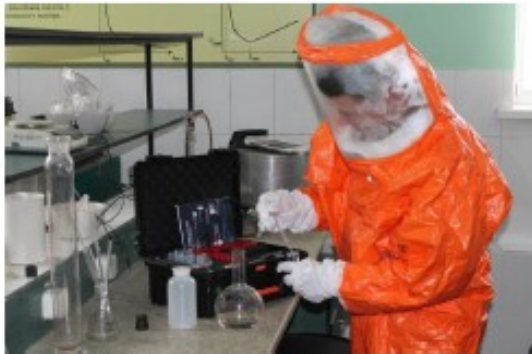
Рис. 1 – Відбір проб речовини для аналізу

Перед проведенням відбору проб, необхідно проаналізувати надзвичайну ситуацію [9, 10, 11]. За результатом аналізу, необхідно визначити план роботи. Метою операції є отримання додаткової інформації про надзвичайну ситуацію. Відбір проб, рис. 1, здійснюється для отримання інформації про безпеку речовини, передусім це вивчення зразків у лабораторії.