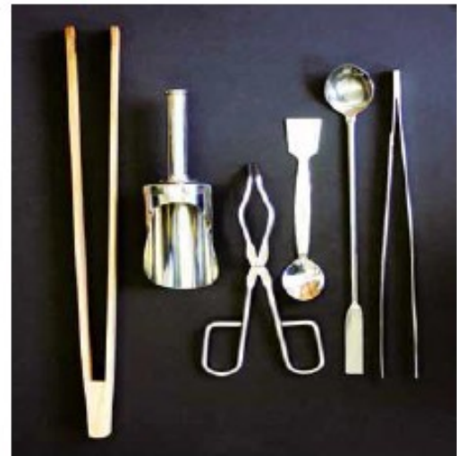
Рис. 4 – Інструменти для відбору проб (зліва направо): щипці великі, лопатка, кліщі тигельні, ложка-шпатель маленька, ложка-шпатель велика, пінцет

Якщо кількість підозрілої (небезпечної) речовини невелика, то цей матеріал проби повинен бути зібраний в скляну пляшку в повному обсязі. Якщо є достатня кількість матеріалу для зразка проби, необхідно помістити не менше 100 мл в скляну пляшку. Великі зразки проб повинні бути упаковані в контейнер (наприклад, пляшка об'ємом 500 мл). Лопаткою, ложкою або шпателем, можуть бути взяті порошкоподібні і пухкі зразки проб. Кліщі тигельні допомагають підібрати маленькі камені і предмети, пінцет використовується для ще більш дрібних предметів рис. 4. Якщо можливо, температуру всіх матеріалів слід перевіряти і записувати ці дані.