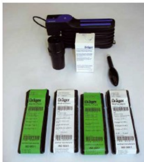
Рис. 5 – Ручний насос та індикаторні трубки

сильфони відпускаються, повітря автоматично прокачується, і зразок вимірюваного газу втягується через використовувану трубку.