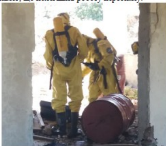
Рис. 6 – Робота групи відбору проб в засобах індивідуального захисту

Під час роботи з невідомими речовинами, необхідно використовувати автономні дихальні апарати (рис. 6) з газонепроникними захисними костюмами. Якщо небезпечна речовина і її характеристики відомі, рівень захисту може бути адаптований відповідно до вимог, що полегшить роботу персоналу.