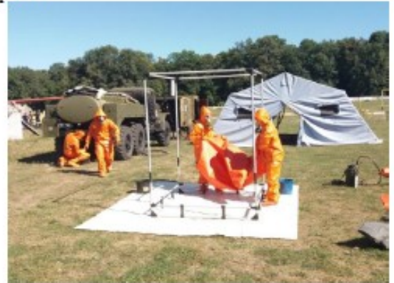
Рис. 2 – Група проведення деконтамінації

Розподіл завдань серед членів команди має відбуватися таким чином, щоб завжди був один «чистий» член команди (помічник). Член команди який збирає зразки (брудний) несе відповідальність за визначення пріоритетів місць (точок) відбору проб та швидке виконання цих робіт.